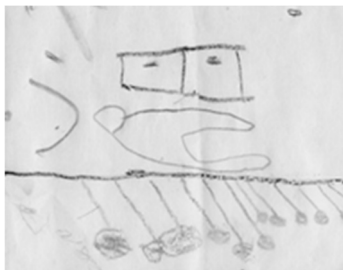
Fig. 3. Reprezentări grafice (copil 4-5 ani) ale ființelor și obiectelor.

Dorința de independență, de afirmare, avântul ori fantezia specifice vârstei, ca și influențele încă semnificative ale mediului (școala, cercul de prieteni, experiențele personale, modelele familiale) pot produce unele transformări sub aspectul alegerii (copierii) unor caractere grafice „interesante” ori modele de semnături, transgresării către o anumită tipologie sau model caligrafic [1] . Pe parcursul anilor de școală primară debutează procesul de individualizare a formelor și detaliilor scrisului. Elevul este motivat puternic de nevoia de a demonstra părinților, dar și învățătorului că „este copil mare” și depune serioase eforturi de reproducere cât mai fidelă a modelelor caligrafice. Pe la 9-10 ani copilul începe să manifeste constant claritate grafică, control asupra coliniarității, fluiditate a liniilor [2] . Silvio Lena arăta, citându-l pe J. Peugeot, că scrierea poate deveni personală numai dacă scriptorul copil a depășit [3] dificultățile grafomotorii și că „aparența nu trebuie să inducă în eroare: nu trebuie interpretată ca originalitate modul în care se evită o mișcare pe care de fapt nu este capabil să o deprindă”.